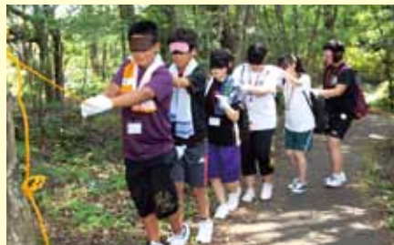
目隠しをしてみんなで協力して進みます (フィールドワーク)