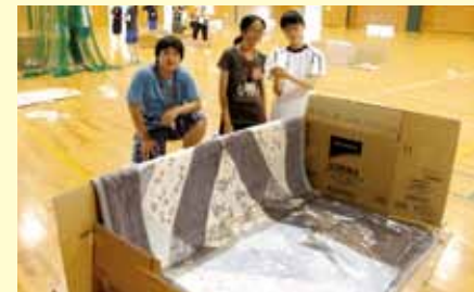
ダンボールハウスを制作 (防災教育プログラム)