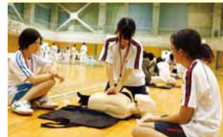
心肺蘇生を学ぶ (健康・安全プログラム)